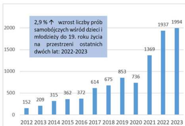
Wykres 1. Liczba prób samobójczych wśród dzieci i młodzieży do 19. roku życia w latach 2012-2023 (wykres sporządzony na podstawie danych z wykresu zamieszczonego w raporcie: Zrozumieć, aby zapobiec 2024 – II edycja raportu. https://backend.zwjw.pl/media/attachments/Raport_zwjw_2024_Wo8JsWZ.pdf )