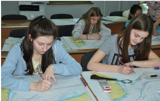
Fot.2. Zajęcia z nawigacji terestrycznej. Opisywanie kursu na mapie