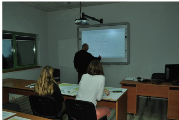
Fot.1. Zajęcia z nawigacji terestrycznej. Warsztaty nawigacyjne. Praca na mapie