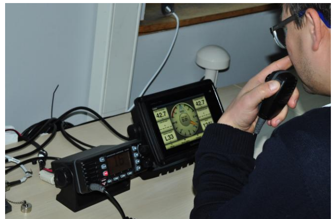
Fot.3. Zajęcia z nawigacji technicznej. Aktywacja GPS. Integrowanie pracy urządzeń