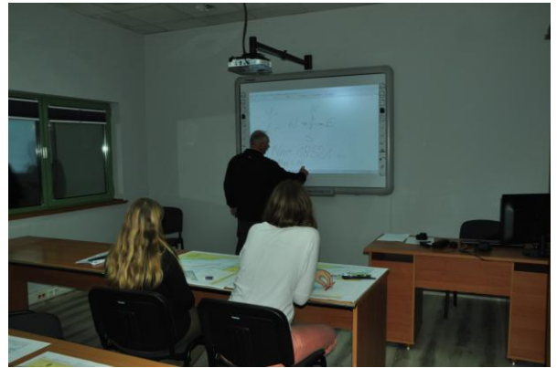
Fot.1. Zajęcia z nawigacji terestrycznej. Warsztaty nawigacyjne. Praca na mapie