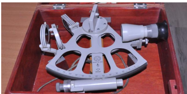
Fot.6. Przyrząd nawigacyjny - sekstant