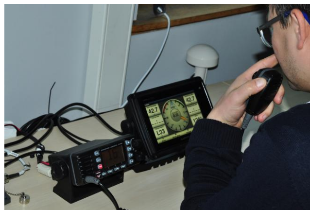
Fot.3. Zajęcia z nawigacji technicznej. Aktywacja GPS. Integrowanie pracy urządzeń