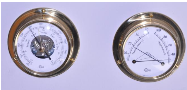
Fot.8. Instrumenty meteorologiczne - barometr i higrometr