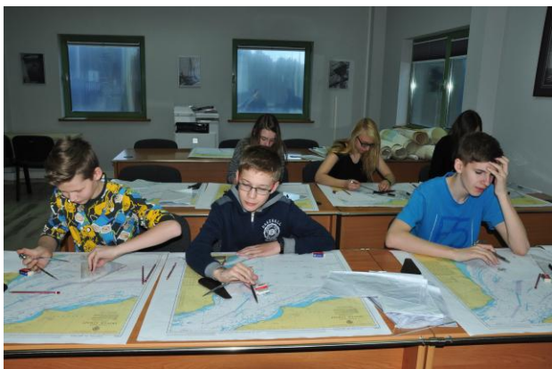
Fot.4. Zajęcia z nawigacji terestrycznej. Wykreślanie kursu na mapie