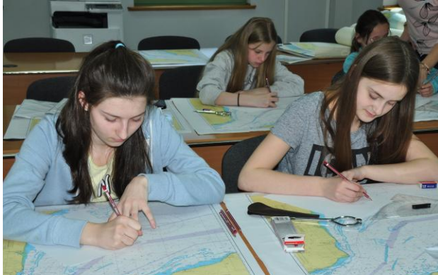
Fot.2. Zajęcia z nawigacji terestrycznej. Opisywanie kursu na mapie